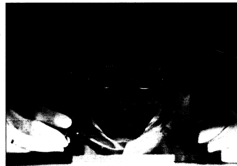
Der Doktorand Jan Eickhoff schneidet auf dem UV-Leuchtpult kleine DNA-Abschnitte, die sich im Glas spiegeln, aus einem Gel heraus. Das Foto erhielt den

Festgeschrieben werden soll mit dem Gesetz ferner, daß die Arzneimittelhersteller ihre Preise vom 1. April 2006 bis 30. März 2008 nicht erhöhen dürfen. Dieses Moratori-