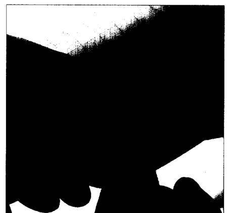
Ulcus cruris venosum: Kosten sparen durch innovative Produkte?