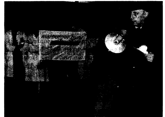
Warnstreik an der Uniklinik Köln

zung um den Abschluss eines arzt-spezifischen Tarifvertrages für die kommunalen Kliniken. Der Grund: Die Vereinigung der Kommunalen Arbeitge-