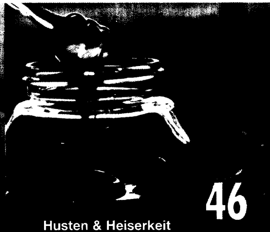
Husten & Heiserkeit