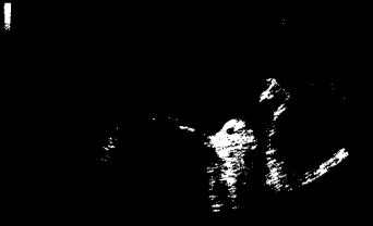
Mitralklappenendokarditis dargestellt mittels transösophagealer Echokardiographie.