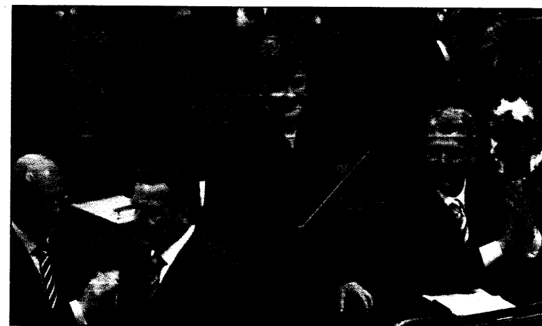
Wachablösung: Gerhard Schröder und Angela Merkel nach der Bundeskanzlerwahl gestern im Parlament.

Wichtige Ergebnisse nach einem Jahr: Im Vergleich zu Personen ohne Sicherheitsprogramm hatten Personen mit diesem Programm eine um 40 Prozent niedri-