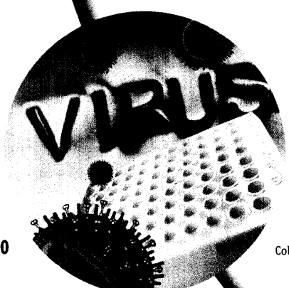
Collage: Annette Sahlmüller

Die Überwachung von Influenzaviren bildet die Basis für eine frühzeitige Entdeckung neuer Varianten. Seite 30