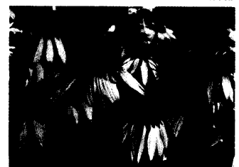
Der rote Sonnenhut wirkt nicht bei grippalem Infekt.