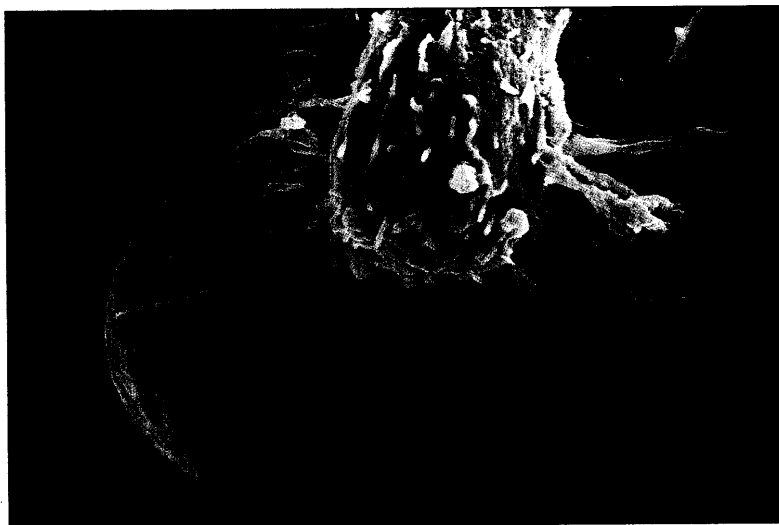
Eine Krebszelle kriecht in eine Filterpore: Für dieses Bild hat Anne Weston den ersten Preis für Medizin-Fotos gewonnen.

Professor Gerd ni Münster mit der PROCAM- OCAM steht für