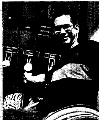
37 Tanken für die DGHS?

In eigener Sache: Die HLS-Redaktion bittet alle Leserinnen und Leser um Verständnis, wenn diese HLS-Ausgabe nicht wie üblich bereits Anfang Oktober versandt wurde. Der Erscheinungstermin wurde verschoben, weil es sich bei diesem Heft um eine umfangreiche Sonderausgabe zum 25-jährigen Bestehen der DGHS handelt.