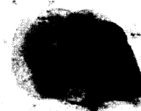
Neisseria meningitidis führt gerade bei Erwachsenen zur Meningitis.