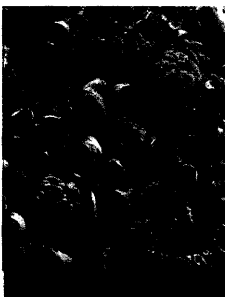
Rasterelektronenmikroskopische Aufnahme eines Glomerulus

Medizinische Klinik III, Westfal-Klinikum GmbH, Kaiserslautern