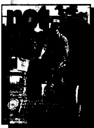
Zum Titel: Mobilität beeinflusst nicht nur die körperliche Konstitution, sondern auch das Selbstwertgefühl von behinderten Menschen.