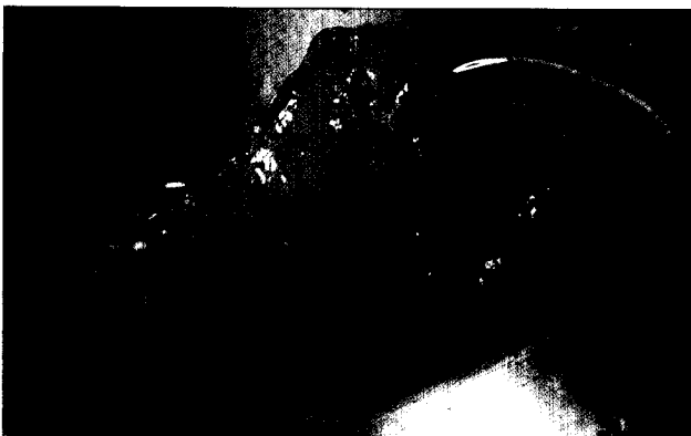
Odontogene Entzündungen, Diagnose und Therapie Seite 20