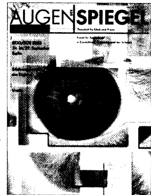
Titelbild: Juvenile rheumatoide Arthritis, Bandkeratopathie.