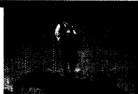
Franz von Lenbach Hirtenknabe auf einem Grashügel (1860) Bildbetrachtung auf Seite 220 dieser Ausgabe