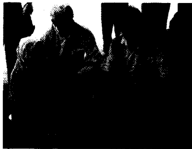
Titel DRK-Präsident Seiters und DRK-Sonderbotschafter Hofer informierten sich im Sudan