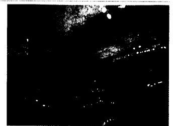
Diffuse Sickerblutung im Coecum.