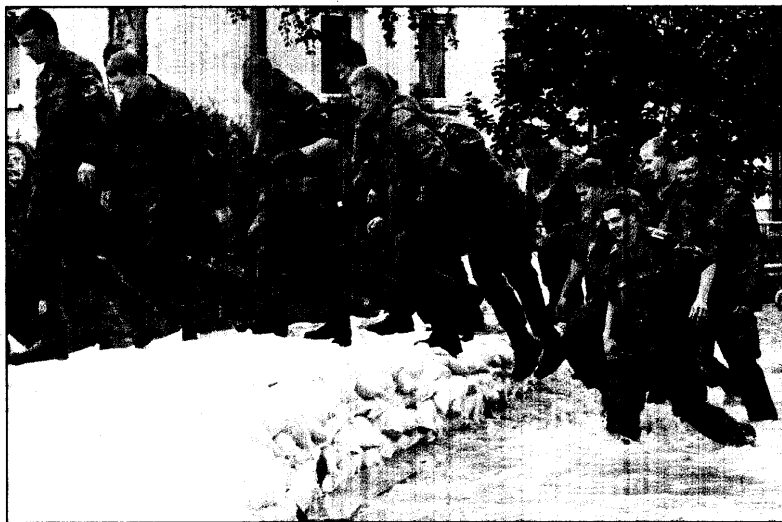
Bundeswehrsoldaten waten gestern in Neu-Ulm durch eine überflutete Straße. 2000 Soldaten waren im Einsatz gegen das Hochwasser.

„Wir sind mit einem blauen Auge davongekommen“