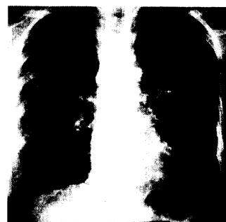
Lungenkarzinom und Lymphangiosarcoma.