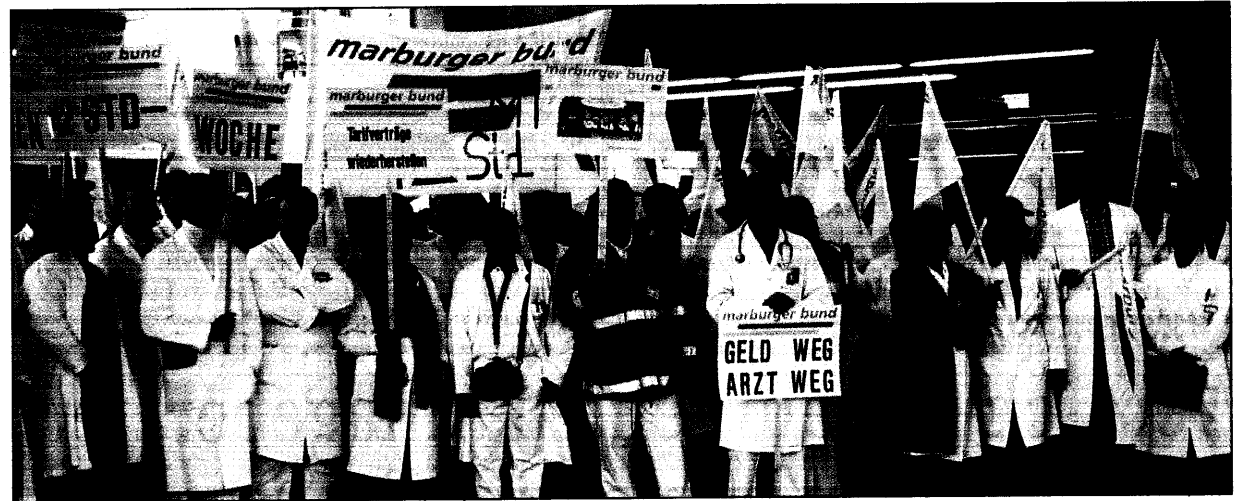
Am 5. August sollen sich die Streikbilder von Klinikärzten aus Marburg wiederholen: dann in Berlin.

Reisenden in Entwicklungsländer, in denen ein hohes Tollwut-Risiko besteht – vor allem in Asien – sollte bei der reisemedizinischen Beratung vor Urlaubsantritt auch genau erklärt werden, wie sie sich nach dem Biß eines möglicherweise infizierten Tieres verhalten sollen: Die Wunde muß sofort mindestens zehn Minuten lang mit Jodsalbe ausgewaschen werden. Anschließend sollte mit 70prozentigem Alkohol oder einem Jodpräparat behandelt werden, um das Kontaminationsrisiko zu mindern. Dann muß ein Tollwutbehandlungszentrum aufgesucht werden. Schon vor der Reise sollten sich Touristen erkun-