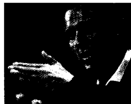
Prof. Dr. Julian Nida-Rümelin