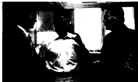
Stuttgarter Zahnärztetag 2005 Spagat zwischen Wunsch und Wirklichkeit

„Schöne Zähne wollen lächeln“ – Der Stuttgarter Morgen