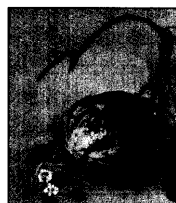
Titelbild: Wassermelone, Koloquinthe ( Citrullus colocynthis Schrad.). Familie: Cucurbitaceae (Kürbisgewächse).