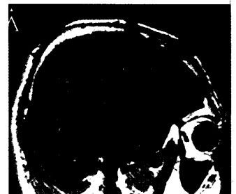
Überlagerung von SPECT und MRT