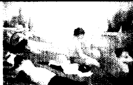
Georges-Pierre Seurat Badestelle bei Asnières (1884) Bildbetrachtung auf Seite 164 dieser Ausgabe