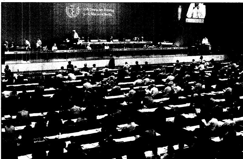
Strammes Arbeitspensum: Die Delegierten des Ärztetages in Berlin haben über ein breites Themenspektrum diskutiert und abgestimmt.

Die Rahmenbedingungen für ärztliches Arbeiten sollen auch auf die Tagesordnung des nächsten Ärztetages 2006 in Magdeburg ge-