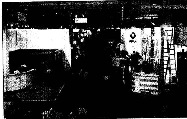
Am Montag wurde in den Messehallen noch emsig gebaut.

ter (61 Prozent der Gesamtbe- teiligung) kommen aus dem Aus- land. Deutschland als Gastgeber ist mit ca. 600 Unternehmen da- bei, die USA und Italien mit je- weils 170. Die Veranstalter hoffen, den Besucherrekord von 2003 (62.000 Fachbesucher) in die- sem Jahr übertreffen zu können. Hervorgehoben wurde noch ein- mal die besondere Rolle der IDS nicht nur als Dentalfachmesse, sondern auch als Fortbildungs- und Kommunikationsplattform der dentalen Welt.