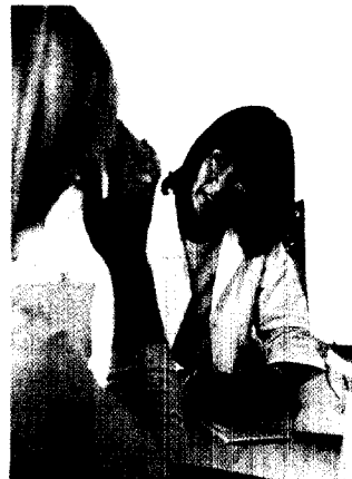
nachgestellte Situation