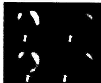
Tc-99m-MIBI-SPECT nach ergometrischer Belastung.