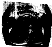
Unser tolles T-Shirt 2005 Bestellmöglichkeit Seite 53