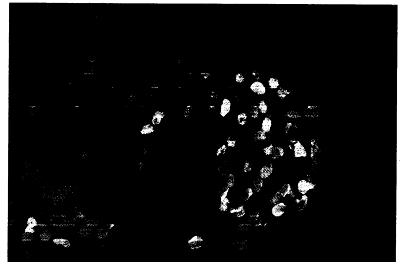
Menschliche Blutstammzellen produzieren im Rückenmark (rot) von Hühner-Embryonen Motoneurone (grün), die sich am Aufbau des Nervengewebes beteiligen.