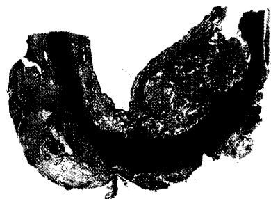
Klarzellchondrosarkom zwischen Schleimhaut und hyalinem Knorpel. ▶ Seite 357