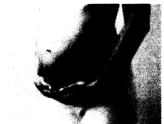
Kortikosteroide während der Schwangerschaft? Auf die Darreichungsform achten.