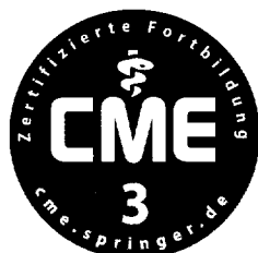
Jetzt 3-fach punkten ▶ Seite 223