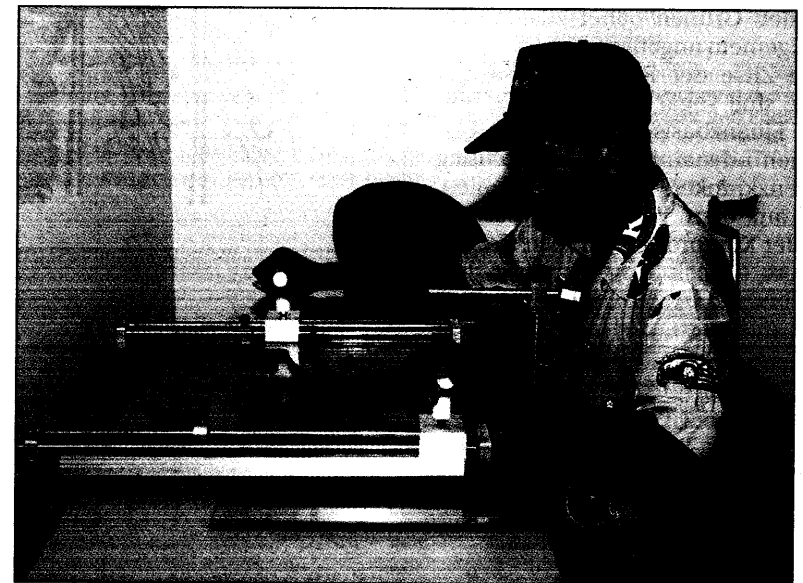
Mit rhythmischem Training beider Arme gehen Hemiparese-Patienten gegen motorische Behinderungen an.

Schlüter warnt vor falschen Schlüssen: „Auch bisher konnten wir in vielen Fällen keine zusätzli-