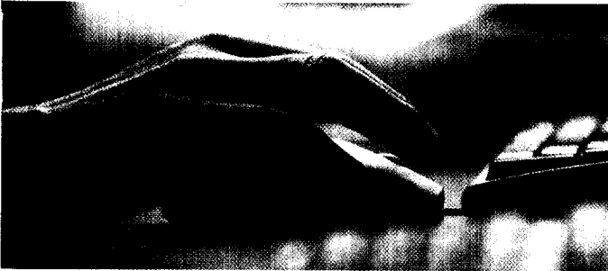
Projektplanung zahlt sich aus