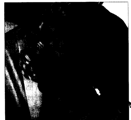
Aufpassen: In 2005 sind einige steuerrechtliche Änderungen in Kraft getreten.