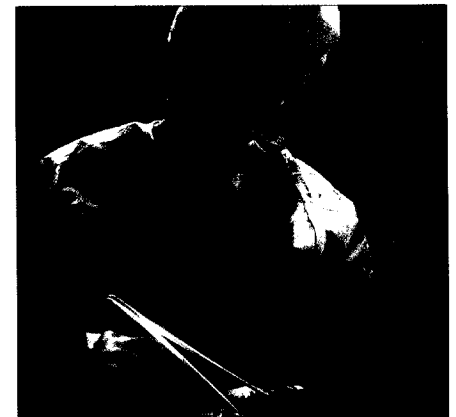
Eine Metaanalyse beleuchtet die verschiedenen Methoden der Leistenhernienoperation.