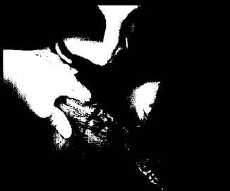
Die klinische Einschätzung der Schwere des akuten Abdomens ist unumgänglich.