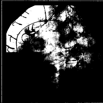
Traumatische Aortendissektion nach endovaskulärer Versorgung