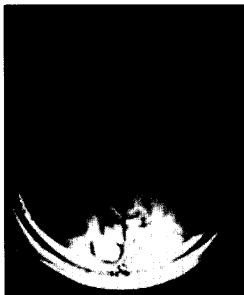
Intensitätscharakteristik für eine zirkular polarisierte Kopfspule (oben) und eine Oberflächenspule (unten)