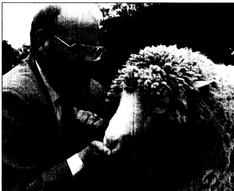
Als Dolly noch lebte: Paul-Ehrlich-Preisträger Ian Wilmut mit dem ersten aus einer adulten Zelle geklonten Säugetier.

kovigilanz-Ärzte an zehn große Krankenhäuser mit bedeutenden internistischen Abteilungen entsenden. Damit werden zwei Ziele verfolgt: Mit der Erfassung von Nebenwirkungen, die Grund für die Klinikeinweisung sind, und einem Vergleich der Verordnungsdaten niedergelassener Ärzte im Einzugsbereich der jeweiligen Klinik will man Aufschluß über die UAW-Häufigkeit in Deutschland und damit eine neue Qualität epidemiologischer Daten erhalten. Zum anderen sollen die Phar-