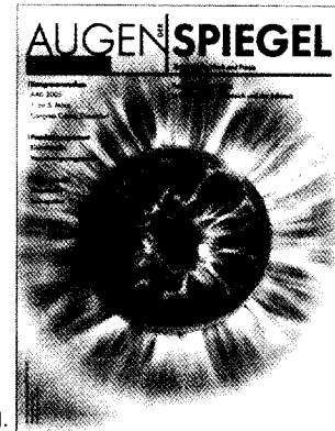
Titelbild: Okulokutaner Albinismus.