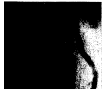
Akuter Vorderwandinfarkt im Koronarangiogramm.