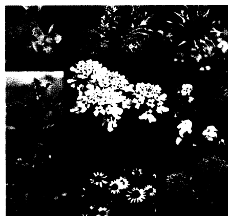
Pflanzen & Dyspepsie