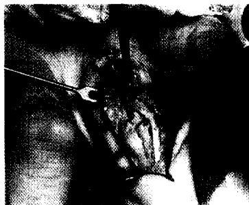
Intraoperativer Situs des PIP-Gelenks D 3