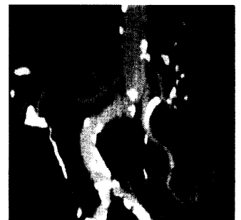
Generalisierte, obliterierende Aortensklerose.