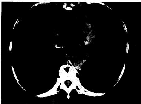
Bei der Entfernung von Fremdkörpern reicht ein flexibles Endoskop meist aus: Seite 14

Koloskopien 19 Bei Darmreinigung bewährte Lösung