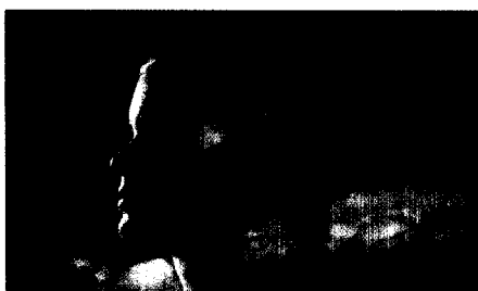
Farbe & Psyche: Licht