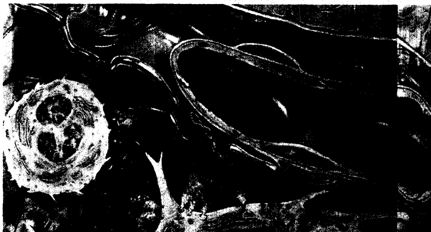
Seite 69 System der Grundregulation mit Beziehungen zwischen Endstrombahn, Grundsubstanz und Bindegewebszellen (nach Pischer und Heine).

Rudolf Inderst Diabetes mellitus – eine Störung der Matrix und der Grundregulation Diabetes mellitus – alterations of matrix regulation ..... 69