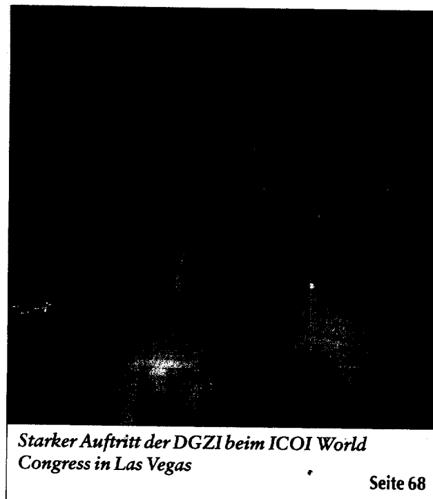
Starker Auftritt der DGZI beim ICOI World Congress in Las Vegas