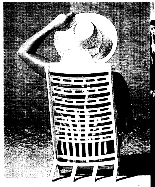
Millionen Menschen reisen jedes Jahr in tropische Regionen, wo sie neben Sonne und Strand eine Vielzahl von Erregern erwartet. Die Prävention und Therapie von Reisediarrhö ist daher ein wichtiges Beratungsthema. Seite 22